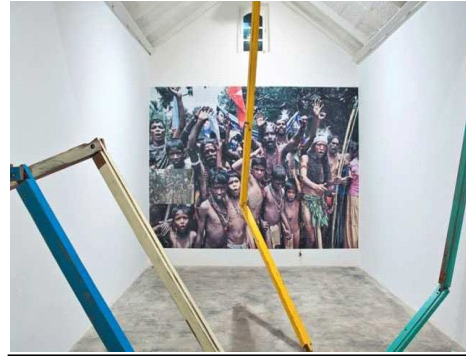
Sheela Gowda, Protest, My Son, 2011, ink-jet print on wallpaper, watercolor and ink-jet print on paper, horn, fur, glass, 12' 8" x 8' 63

बनाया है जो एक आज आत्मनिर्भर होकर अपना व परिवार का भरण-पोषण कर रही हैं तथा कुछ तो कलाकार के रूप में ख्याति भी प्राप्त कर रही हैं। 6 प्रफुल्ला दहानुकर जो एक चित्रकार थीं उन्होंने भी अपनी चित्रकला के माध्यम से पुरुष वर्चस्व वाले कलाकारों के समय में एक अपना अलग स्थान बनाया जा कि अपने आप में यह सिद्ध करता है कि यदि मन में ठान लिया जाए तो