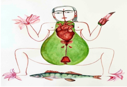
Rekha Rodwittiya, Sixty: Transient worlds of belonging. 2018. Watercolour on paper, 22 x 30 inches.

कुछ भी असंभव नहीं। उन्होंने अनेकों युवा कलाकारों को प्रोत्साहित किया तथा उनकी हर सम्भव मदद की ताकि वे अच्छे कलाकार बन सकें। प्रफुल्ला ने बिना किसी भेदभाव के समाज के हर वर्ग के व्यक्ति को प्रेरित किया जिसमें उन्हें कलाकार या चित्रकार बनने की इच्छा दिखी। 7